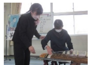
実際にひいてみました