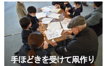
手ほどきを受けて凧作り

老人会の皆様も保護者様もたくさんご参加いただきました。ご協力に感謝申し上げます。