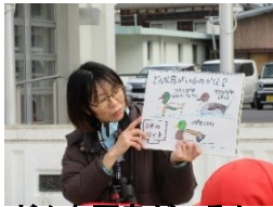
どんな野鳥がいるか

2月4日に3年生は、ラムサール条約登録地の肥前鹿島干潟へ野鳥観察に行きました。たくさんの野鳥が干潟にエサを求めて飛来していました。市のラムサール条約推進室の方から説明を受け、まず運動